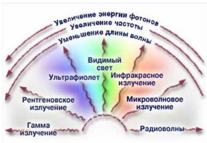
Виды радиационного излучения.

Все бытовые приборы, работающие с использованием электрического тока, являются источниками электромагнитных полей. Наиболее мощными следует признать СВЧ-печи, аэрогрили, холодильники с системой “без инея”, кухонные вытяжки, электропли-